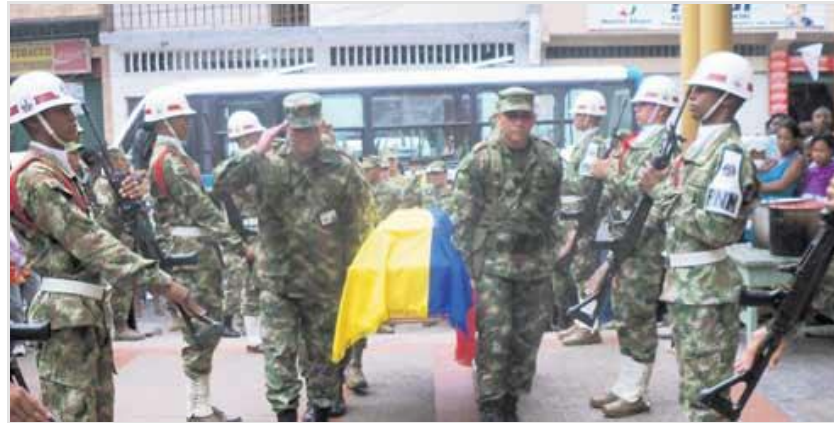
Ayer se llevó a cabo, en Tumaco (Nariño), el sepelio colectivo de los militares asesinados el viernes por la columna 'Daniel Aldana', de las Farc.

Por: REDACCIÓN JUSTICIA | 10:12 p.m. | 23 de Octubre del 2011